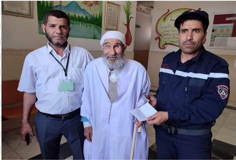
الحاج دباب من ولاية بالجلفة كيف وفي عمر الثمانين يجتاز امتحان البكالوريا..