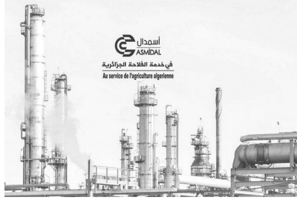
أسمدال "يعكف حاليا على دراسة وتحليل عناصر و

كما أشار أنه "و نظرا لكون ملف النزاع يخضع لواجب السرية الذي تخضع له جميع الأطراف، يعتذر مجمع أسمدال عن عدم امكانية اعطاء تفاصيل أخرى حول الموضوع".