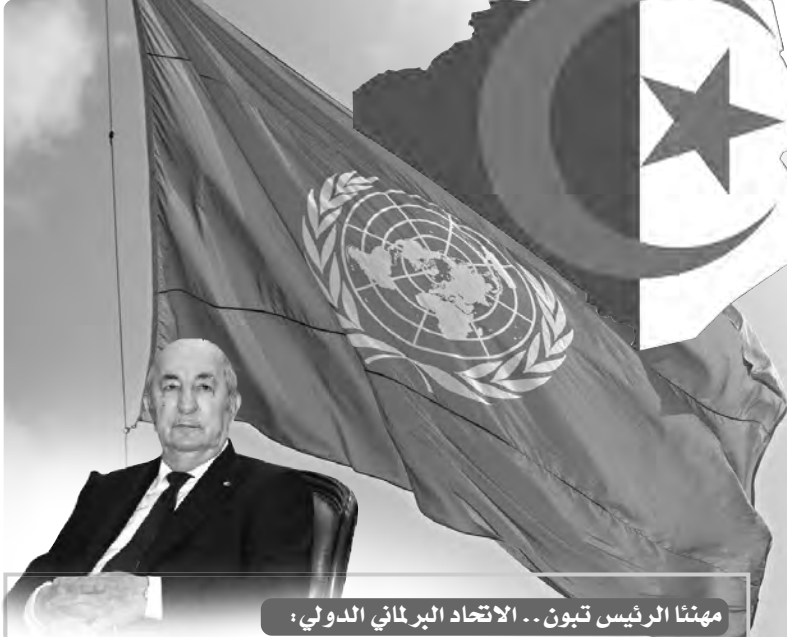
مهنتا رئيس تبون.. الاتحاد البرلماني الدولي:

اعتبروا انتخابها لمجلس الأمن نتيجة لتقلها السياسي والدبلوماسي.. خبراء: