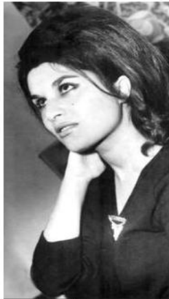
— انتبهنا... الآن يجب أن نقيم مجلس عزاء، انتظرنا عشرين عاماً