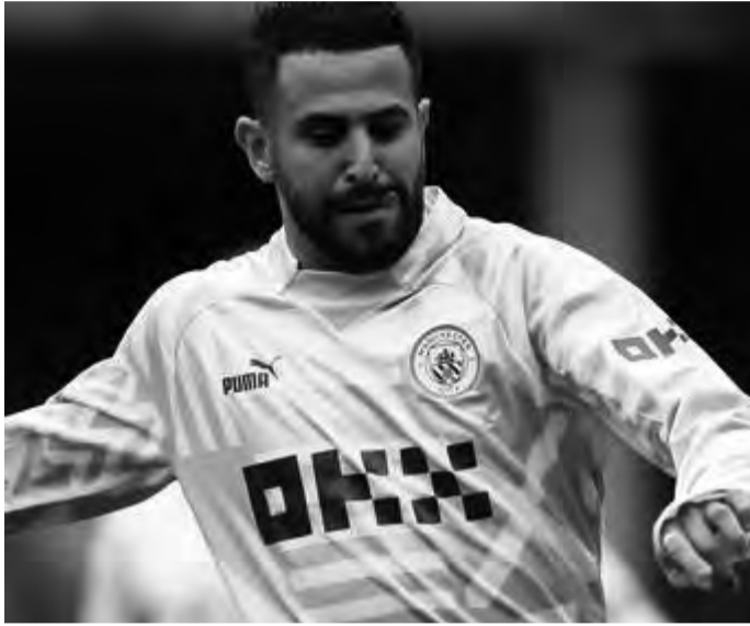
إمكانية عقد صفقات مع عدة لاعبين، من بينهم محرز.

وختتمت: "محرز منفتح على الانتقال للسعودية، لكن العقبة الحالية تتمثل في مانشستر سيتي، وعمّا إذا كان سيسمح النادي له بالمغادرة أم لا".