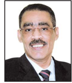
■ بقلم: شوان رشوان

كانت الجغرافيا تلعب دوراً شديداً الأهمية في أداء وسياسات معظم دول العالم، وتحدد في كثير من الأحيان طبيعة أدوارها في النظام العالمي الذي توجد ضمنه هذه الدول منذ مئات السنين. ولعل تأثير الجغرافيا بدأ شديد الوضوح في أداء دول القارة الأوروبية التي تتوسط العالم شمالاً، وهو ما جعلها طوال قرون متتابعة في قلب تفاعلاته، وأصبحت القوى الاستعمارية الأكبر في التاريخ وامتدت احتلالاتها لتشمل أركان العالم الأربعة. وعلى العكس تماماً، لم يعط الموقع المنعزل لدول القارة الأمريكية الجنوبية في جنوب غرب الكرة الأرضية بين المحيطين الأطلنطي والهادي، فرصة لها طوال قرون متعاقبة لكي تقترب من دول العالم الأخرى أو يكون لها تأثيرات متنوعة عليها.