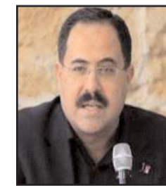
■ بقلم: صبري صيدم

وبعد أن أحكمت بعض تلك المنصات السيطرة على المعلومات، عادت لتشكيل مجالس استشارية تتكون عضوية البعض منها من عسكريين ووزراء سابقين