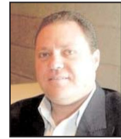
■ بقلم: سري القودة

تتواصل شراسة عدوان حكومة الاحتلال الفاشية وعصابات المستوطنين في ظل امتناع العالم ومؤسساته عن تحمل مسؤولياتهم بإنهاء الاحتلال ووقف جرائمه وإرهابه بحق الشعب الفلسطيني واستمرار الاحتلال بممارساته الإرهابية والتي باتت تشكل خطورة بالغة على المستقبل الفلسطيني وقرصنة وسرقة ما تبقى من الأراضي الفلسطينية المحتلة وما يجري من انتهاكات في مدينة القدس ومخططات التهويد والتي دخلت مرحلة خطيرة حيث تستمر حكومة التطرف الإسرائيلية بمشاركة تغير معالم المدينة المقدسة في استهداف واضح لمقدساتها وأحيائها وشوارعها وواقعها القانوني والتاريخي والحضاري، وآخرها تحويل