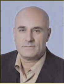
■ بقلم: محمد سلامة

منظمة «بونيه إسرائيل» تأسست في 2022م، من نحو ثلاثين متطرفاً يهودياً، قاموا بشراء خمسة عجول حمراء نادرة من ولاية تكساس الأمريكية، واحضروها لإسرائيل من أجل التضحية بها وفقاً للتعاليم اليهودية.