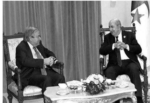
القرار الدولي الهادف إلى تعزيز السلم والأمن

الدوليين "وبذلك -يوضح الرئيس تبون- "ستتاح للجزائر فرصة متجددة، بعد توليها رئاسة جامعة الدول العربية بنجاح لإعادة تأكيد المبادئ والمثل المؤسسة لسياستها الخارجية وتشاطر رؤيتها بشأن المسائل المدرجة في جدول الأعمال الدولي لمجلس الأمن، معتمدة في ذلك على إرثها التاريخي الثقل".