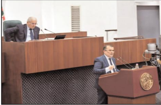
الشهادات، ذكر السيد بن طالب أنه تم إدماج أزيد من 500 ألف المعدل والتسم للقاتون رقم 12-83 المتعلق بالتقاعد أكد بن

أكد وزير العمل والتشغيل والضمان الاجتماعي، فيصل بن طالب، على أهمية تفعيل الشبابيك المتنقلة بهدف تقريب خدمات الضمان الاجتماعي من المواطنين المتواجدين بالمناطق البعيدة.