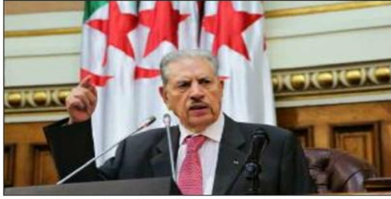
الجزائر الجديدة المؤسسة على الثوابت ومثل الحق والكسب والإنجازات المستمدة من الارث النوفيري والعدل والانصاف والقانون والجهد والتضحية والخالد.

أعرب رئيس مجلس الأمة، السيد صالح قوجيل، عن عرفانه لرئيس الجمهورية، السيد عبد المجيد تبون، للرعاية التي أولاها لمشروع انتخاب الجزائر كعضو غير دائم بمجلس الأمن للأمم المتحدة، مهنتا إياه على هذا الإنجاز الذي تحقق عن «جدارة واستحقاق»، حسب ما أورده بيان للمجلس.