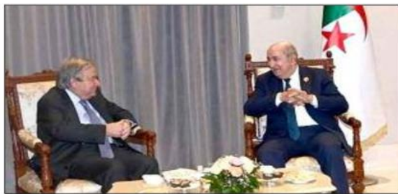
الأعمال الدولي مجلس الأمن، معصدة في ذلك على إرتيا التاريخي الثقيل.