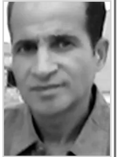
بقلم: جمال نصرالله

أهمها وعصبها الفخر والتفاخر. وحب تأكيد الذات؟ وقد فسر اختصاصيون بأن الكذب وُجد وظهر للوجود منذ بدء البشرية، وهو ملتصق بالحالة النفسية للفرد وعلاقته بالطبيعة والمحيط وأقرانه من الناس، وفي ظل التطور المستمر والمتقدم صارت لهذه الآفة خنازق ومنعرجات كبرى بحجة تنوع وانتشار ظروف الحياة الصعبة والمعقدة، وليس شرطا أن نلتجئ لوحيد مثل سيجموند فرويد الذي فسر هذا السلوك على أساس أنه تابع من ذات تعشش بها طبقات من الصدمات المكبوتة، بل السؤال الوجيه ما هو الأمر من قبل فرويد أي في تاريخنا العربي مثلا ومع مختلف الحضارات السابقة، لأن الكذب لم يكتشفه فرويد فقط، بل هناك في التراث قصصا وحكايات تبرز وتبين الكثير من الأحداث المليئة به؟ كما ذهب في ذلك صاحب كتاب أخبار الحمقى والمغفلين لأبو فرج بن الجوزي الذي جاء فيه بأن الذين يكذبون ليسوا فئة الحمقى فقط بل حتى الأذكى والساسة والمسؤولين والأدباء، وخلص في النهاية عن أنه مسألة أخلاقية صرفة بحنة تتعلق بثقافة الشخص وتربيته بل نشأته منذ طفولته وهي من العادات السيئة التي تبين بشكل أو بآخر أعراض وطموحات صاحبها. فلماذا يمارس هذا النوع من السلوك المقزز وما الذي أراد الوصول إليه من خلال امتهانه هذا التصرف والمضي في طريقه، إذا الخلاصة الرئيسية هو أن الكذب هو معضلة حضارية واجتماعية ونفسية في نفس الوقت لأن جميعهم يصب في الآخر ويشترك معه في الدور والعلاقة المتبادلة ولا يستطيع الآخر أن ينفصل عن نظيره مهما كانت الظروف. التنشئة الاجتماعية هي