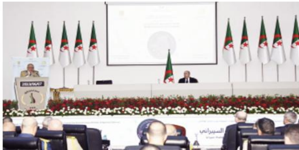
تشكيلة عسكرية التحية الشرفية.

كما ستعرف أشغال الملتقى مناقشة مواضيع هامة أخرى بغرض الوقوف على أفضل السبل وأهم المستجدات لاعادة الإستراتيجية الوطنية لأمن الأنظمة المعلوماتية التي هي مسؤولية جماعية، وبالتالي الخروج باقتراحات وتوصيات لمواجهة مختلف المخاطر والتهديدات الحاصلة في الفضاء السبيرياني، لاسيما من خلال اشراك جميع الفاعلين المعنيين للتكفل بالتاج بها.