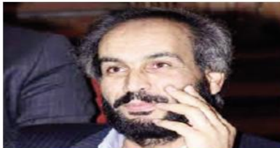
يقلم: حسن حميد

انتفاضة الإداريين، رفضاً لجرميّة الاعتقال الإداري. وقالت اللجنة، في بيان صادر عنها، اليوم الإثنين، "ستشروع كاسرى إداريين بمشروع وطني متكامل مناهضة الاعتقال الإداري، يشترك ويتفاعل فيه جميع الأسرى الإداريون من كافة أطياف الحركة الأسيرة تحت مظلة العلم الفلسطيني، ويشمل المشروع كافة الأدوات التضاللية وعلى رأسها الإضراب المفتوح عن الطعام ومقاطعة المحاكم المستمرة منذ أيلول الماضي والبرامج التضاللية المساندة لتضاللات الأسرى الإداريين في مشروعم". وشددت على أن مطلب الأسرى الإداريين الرئيسي هو إنهاء الاعتقال الإداري والزام دولة الاحتلال باحترام القانون الدولي