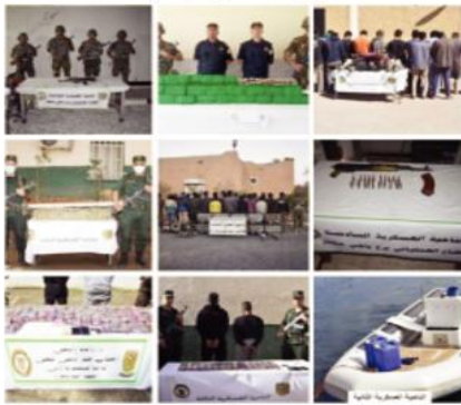
ضبط 417005 قرص مهلوس، عمليات عبر النواحي العسكرية، تاجر مخدرات وأحبطت محاولات إدخال 4 قناطر و1 كيلوغرام من الكيف المعالج عبر الحدود مع المغرب، فيما تم ضبطت 32 مركبة و341 مولدا.

في سياق آخر أحبط حراس الحدود، بالتنسيق مع مصالح الدرك الوطني والجمارك، محاولات تهريب كميات من المواد القابلة للتفجير بـ 72716 لتر تكمن في تسعة سوق أهراس والطارف وتمنرات وبرج باجي مختار.