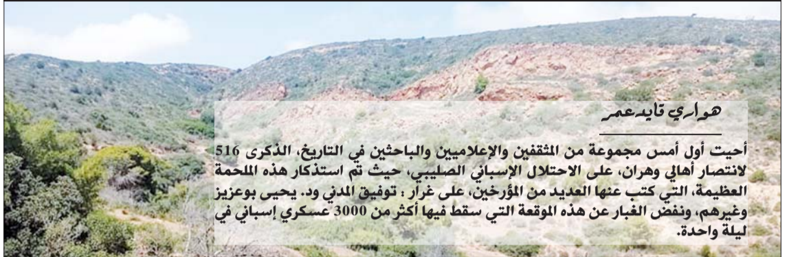
هواري قايد عمر

القضاء على أكثر من 3000 عسكري إسباني بعد اعتداء سافر على «دوار العربي»