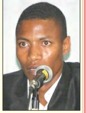
إعداد: محمد الورداني

تعد الرقابة ظاهرة إنسانية متجذرة في البنية التكوينية للكانن البشري؛ إذ إن لها حضورا في المجتمعات البدائية الأولى، واستمرارا حتى حياتنا المعاصرة. بيد أن أسبابها، الظاهرة والمضمرة، والأهداف المرجوة منها، وتجلياتها وتجلياتها، ودرجة حضورها تختلف باختلاف المجتمعات البشرية، والشروط التاريخية والثقافية والاجتماعية لهذه المجتمعات. ومن ثم، أخذت الرقابة وأشكالها وطرق ممارستها تتطور بتطور الوعي والفكر والأهداف على مر التاريخ.