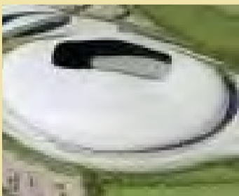
المكسب والمرق العمومي الذي سيعود بالإيجاب على الولاية وأهلها

كشف والي ولاية باتنة الدكتور محمد بن مالك أول أمس عبر مقطع فيديو تم نشره عبر الصفحة الرسمية للولاية على موقع التواصل الاجتماعي "فايسوك" عن رفع التجميد على ملعب بسعة 30 ألف مقعد بولاية باتنة بعد تلقي الضوء الأخضر من طرف الوزير الأول حسبما أكده الوالي، هذا وكان المشروع مجمدا منذ عام 2013، و يأتي هذا المشروع في إطار متابعة مشاريع التنمية ورفع العراقل، وأضاف محمد بن مالك: "الملعب مكسب كبير للولاية وأهني سكان باتنة على هذا