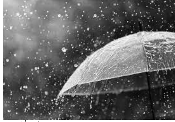
دخول منخفض جوي جديد قادم من المحيط الأطلسي،

سيشمل الجزائر بأمطار جد غزيرة من الغرب إلى الشرق وستستمر هاته الأمطار لعدة أيام. وربما سنشهد دخولا متأخراً لفصل الصيف قد يكون بعد عيد الأضحى المبارك إن شاء الله، حيث ستكون درجات الحرارة دون معدلها الفصلي ولن تتعدى الـ 20 درجة على أغلب الولايات الشمالية. هذا و يبقى العالم لله وحده.