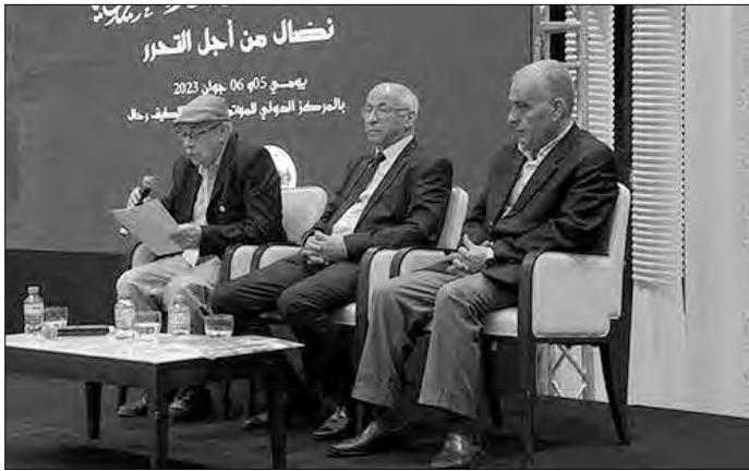
الفرنسية تجاههم أو تجاه ذويهم.