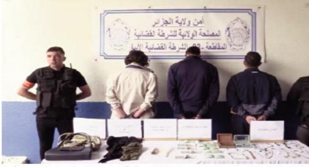
استولى الفاضلون على مبلغ مالي قدره 08 ملايين سنتيم ومجوهرات من المعدن الأضفر

أوقفت شرطة العاصمة ثلاث أشخاص قاموا باقتحام منزل امرأة مسنة تبلغ من العمر 86 سنة، لقرصن السرقعة تحت طائلة التهديد بواسطة سلاح أبيض.