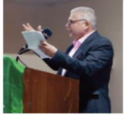
نص الأدب : ناصر عطا الله

تركة الصديق قبل البعيد وحده في ميادين التعب وقال، الله معي ولو كنت وحدي .. فوادي بيت نار وسواصدي من سحب للجزائر كلي يا أنا كلي سهم في العدا .. رمح أوله في الأوراس وأخذه في حلب أنا الجزائر الحرة الباقية