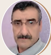
بقلم : بلخير محمد الناصر ص 8