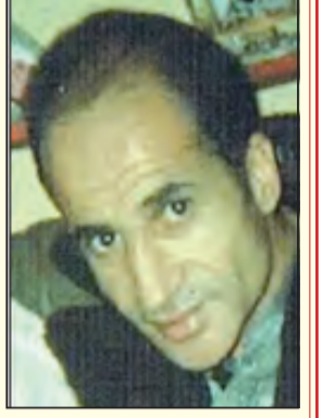
بقلم: جمال نصرالله

كثير من الناس وحتى المتعلمين سامحهم الله، حنتما ترغب في مناقشتهم، أو طرح الأسئلة التي تشغال بالك خاصة في المسائل الدينية.