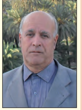
بقلم: الأخضر رحموني

تزامنا مع اليوم الوطني للفنان الذي تحتفل به الجزائر يوم 08 جوان من كل عام، والمصادف لذكرى اختطاف و اغتيال الفنان الشهيد علي معاشي على يد قوات الجيش الفرنسي بمدينة تيارت في 08 ماي 1958 بعدما أزعج الاستعمار بأغانيه الوطنية، نتوقف مع أحد الفنانين ال