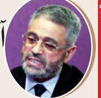
بقلم : أحمد محمود عيساوي ص 7