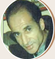
بقلم : جمال نصرالله ص 8