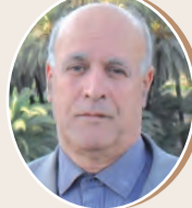
بقلم : الأخضر رحموني ص 9