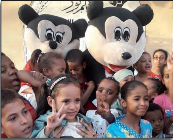
الأطفال الذين تعطشوا لهاته التظاهرة مواهبهم الكثيرة ، كما أنها ستصنع لهم التي انتظروها كثيرا ، والتي ستكشف عن الفرحة و المتعة خلال العطلة الصيفية.