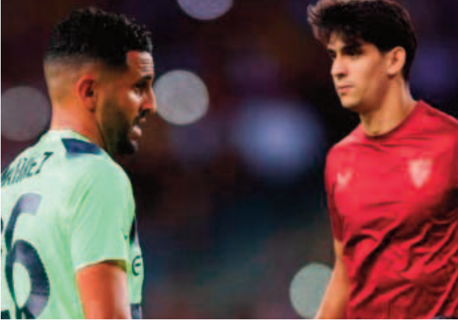
عند الدور الثاني.

لدوري أبطال أوروبا، كما ودع المسابقة هذا الموسم بسقوط ملو أمام ريال مدريد. كما أن ساديو ماني تعرض للإصابة، وظهر بعدها بمستوى باهت مع بايرن ميونخ. ولم يكن النجم الجزائري رياض محرز، أساسيا مع مانشستر سيتي في الكثير من المباريات، لكن في حال مساهمته بدور كبير في تتويج فريقه المحتمل بالثلاثية التاريخية، هذا الموسم، سيحظى حينها بدفعة قوية في السباق على العرش القاري. ويتقدم بونو على هؤلاء النجوم حاليا بفضل ميزة المونديال، وحضوره في السباق النهائي لجوائز الأفضل، وهو ما يقربه من نيل هذه الجائزة، التي تحصل عليها حارسان فقط على المستوى الإفريقي، وهما الزاكي والكامبروني وتوماس نكوون.