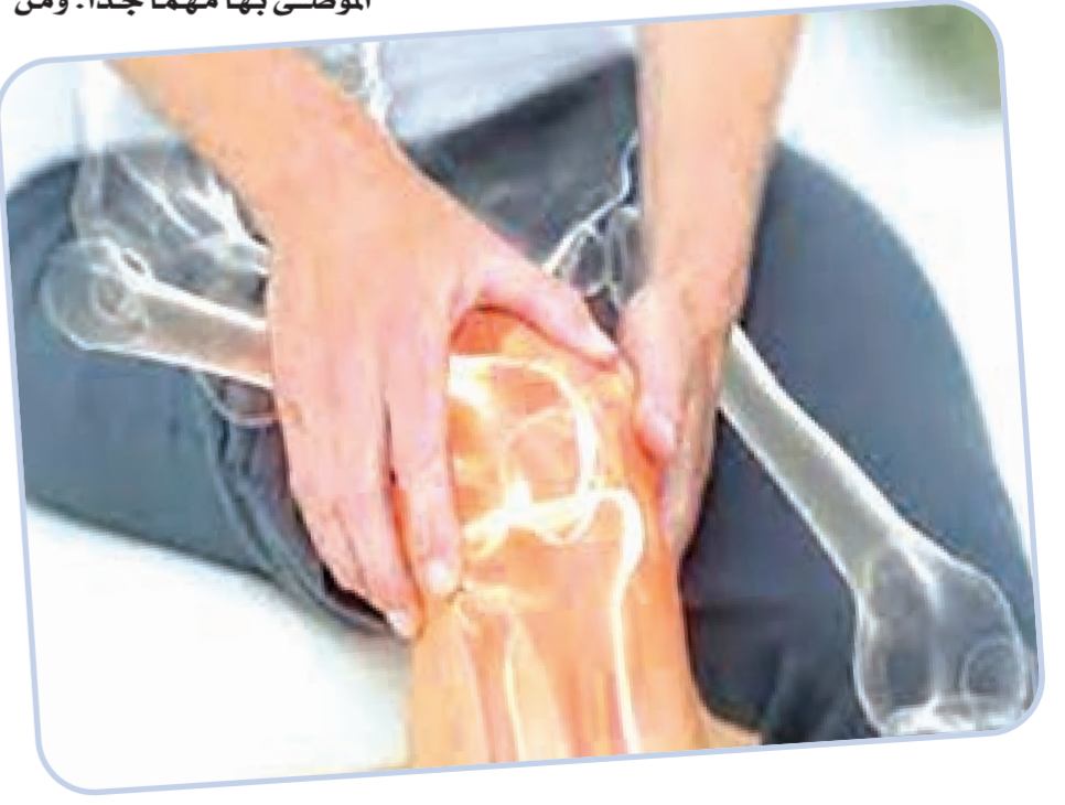
سمية / ب

أكدت دراسة ميدانية حديثة عن المعطيات البوائية لداء هشاشة العظام عند المرأة عن إصابة 63 بالمائة من الجزائريات اللواتي تجاوزن سن الـ45 بداء هشاشة العظام، مشيرة إلى المضاعفات الثانوية التي تنجر عن الموت في بعض الأحيان، إذا ما أهملت المرأة علاجها وتعاملت باستسهال مع المرض، فيما يؤكد الأخصائيون أن العلاج المبكر يمكن أن يحد من انتشار المرض وتطوره، في حين ظهرت في الأفق علاجات جديدة بالتغذية العلاجية نادى بها العديد من أخصائيي التغذية، الذين أكدوا أن التغلب على المرض طبيعيا صار ممكنا.