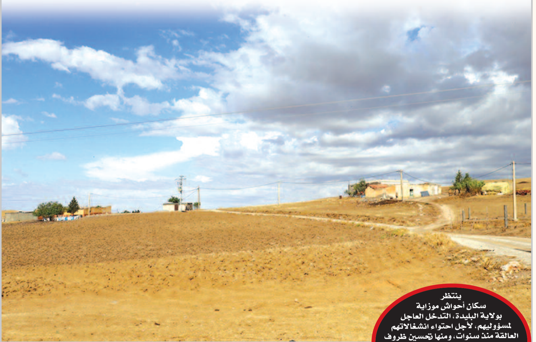
البلدية: مليكة ي.

ينتظر سكان أحواش موزاية بولاية البليدة، التدخل العاجل لمسؤوليهم، لأجل احتواء انشغالاتهم العالقة منذ سنوات، ومنها تحسين ظروف حياتهم اليومية، مشيرين إلى أن الإحيى بحاجة ماسة إلى التفتاة المسؤول الأول على البلدية الذي كان قد وعدهم بدفع عجلة التنمية.