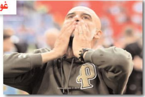
أشاد الإسباني بيب غوارديولا مدرب مانشستر سيتي، بلاعبه فريقه عقب الفوز على مانشستر يونايتد (2-1) السبت على ملعب ويغلي، في نهائي كأس

الإنهاء الإنجليزي، وقال غوارديولا، في تصريحات لشبكة "BBC" عقب المباراة: "يمكننا الآن التحدث عن الثلاثية، بالطبع لا يزال يتعين علينا الفوز بدوري أبطال أوروبا، لقد قدمنا أداءً جيدًا لمبتدئين وصاهيرنا". وأضاف: "مانشستر يونايتد اعتد على طريقة رجل لرجل، ولم نتوقع أن يدافعوا بهذه الطريقة، ووجدنا المزيد من المساحات في الشوط الثاني. والفوز كان مهنا جدًا بالنسبة لنا". وتابع: "كأس الاتحاد الإنجليزي رائعة جدًا. وغداً وفي اليوم التالي سنحصل على راحة، ثم لدينا 3 أو 4 جلسات للتدريب قبل مواجهة إنتر، وسننسى إلى إسطنبول صباح الخميس بعد التدريب". وواصل: "أنا من مشجعي برشلونه، لكنني سأحبه هذا النادي (مانشستر سيتي) طوال حياتي، أعرف اليوم أننا قدمنا لمشجعينا هدية جيدة للاستمتاع بها ضد جيرانتا". وعن تألق غوندوغان، قال: "يا له من موسم خاضه الكاي، يملك مهارات كبيرة وعقلية رائعة، ولعب المباريات الكبيرة بشكل جيد، ويمكنه التعامل مع الضغط بشكل جيد". وفيما يخص جون ستونز ومشاركته في وسط الملعب، قال: "لعب بشكل جيد مؤخرًا وفي مركز غير معتاد بالنسبة له.. ستونز لديه جودة كبيرة في تمرير الكرة". ويستعد مانشستر سيتي لمواجهة إنتر ميلان، يوم السبت المقبل، في نهائي دوري أبطال أوروبا.