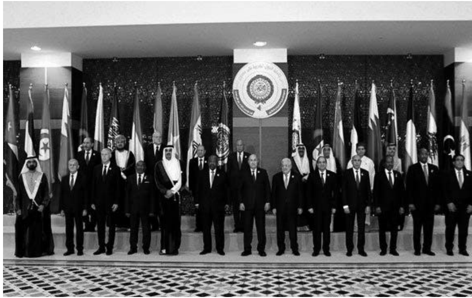
السورية للأنباء "سانا". و المقداد، الذي قلد السفير تهامي الساحة العربية وانعكاسها حسب الوكالة، فقد ثمن الوزير الوسام، التطورات الحاصلة في المرتقب على تفعيل العمل