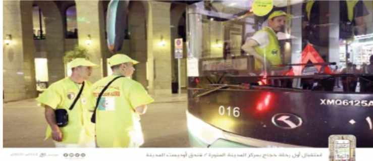
تمشيد أول رحلة حجاج مركز المدينة المنورة 7 شرق أوجيدت المدينة

تم تنصيب لجنة وزارية لمتابعة موسم حج 1444 هـ/2023 م للإجابة على استفسارات قاصدي بيت الله الحرام، وهذا طيلة موسم الحج، حسب ما أوردته السبت بيان لوزارة الشؤون الدينية والأوقاف.