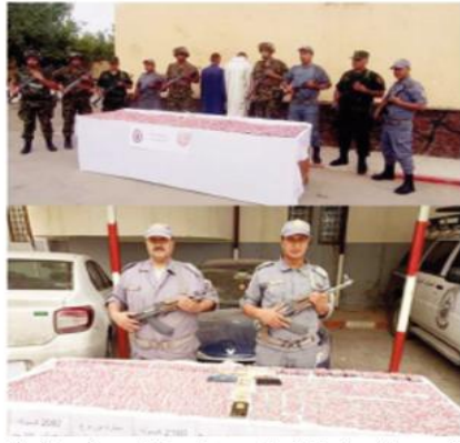
ب.ب. وجاء في البيان انه في سياق تكثيف برامج المراقبة الميدانية للفرقة الجمركية العمليانية، وعلى إثر عمليتين متفرقتين، تمكن أعوان الفرقة المتنقلة للجمارك التابعة لمصالح مفتشية الأقسام للجمارك ببسكرة، بإقليم اختصاص المديرية الجوية للجمارك بقسنطينة، من حجز 4242 قرصا مملووسا من نوع بريفايلاين 300 ملغ، مع توقيف ثلاثة أشخاص واحتالهم على الجهات القضائية المختصة، وحجز سيارتين سياحيتين استعملتا في التهريب. وفي إطار النشاط الميداني المشترك مع الأجهزة الأمنية، أحبط أعوان الفرقة المتعددة المهام للجمارك بالمنيعة، التابعة لمصالح مفتشية الأقسام للجمارك بقرطاج، بإقليم اختصاص المديرية الجوية للجمارك بالأغواط، في عملية مشتركة تم تنفيذها بالتنسيق مع كل من أفراد الجيش الوطني الشعبي وأعوان الدرك الوطني، عملية تهريب 7400 قرصا مملووسا من نوع بريفايلاين 300 ملغ، باستعمال مركبة زراعية الدفع كان على متنها شخصان، يضيف البيان.

أفادت من الفرقة 8200 لتر من المازوت، تم ضبطها على إثر كشف مخبأ مهيأ خصيصا لتخزين البضائع الموجهة للتهرب. كما تمكن أعوان الفرقة المتنقلة الجوية المتخصصة في مكافحة التهرب، التابعة لمصالح المديرية الجوية للجمارك بالجزائر-خارجية، على مستوى نقطة مراقبة ميدانية، من حجز 1370 ساعة ذكية تم ضبطها على متن سيارة سياحية. وتكتمل العمليات المحققة - حسب البيان - النشاط الميداني الضمني لأعوان الجمارك الجزائرية في إطار ممارسة المهام الحماية المنوطة بالجهاز في سبيل حماية الاقتصاد الوطني ومحاربة التهرب والتجارة غير المشروعة لاسيما تهريب المواد المددمة ووات الاستهلاك الواسع وكذا تهريب وترويج المخدرات والمؤثرات العقلية، كما تؤكد التنسيق الميداني المحكم مع الأجهزة الأمنية في إطار مكافحة التهريب وبشئ أشكاله.