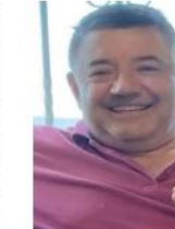
ممنبر أدباء بلاد الشام

عند عنوانها، فهل ما جاء فيها من مضمون كانت حبيسة صدر الكاتب حتى قرأنا، يفتح نوافذه، ليوح بها، خصوصا أنه القائل: لنفتح نوافذنا على العالم، لأن الانغلاق موت ص 163 وحقيقة فقد سيطر على عصر الشوق في هذه المجموعة فأجبرني على قراءة تها في جلسة واحدة، فالسرد القصصية الاتساري، واللغة الساحرة