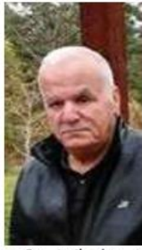
ممنبر أدباء بلاد الشام

يا دهشة سيرت عينيك صاذقة والآن تنسى اوصد في في معلاني! كم كنت في عجب من صدق عاشقة تطرز الحب في صدر الكتابات كنت اشتهاهك حيث الفجر اغنية كنت الذبوية في ريق البدائيات جديدي على انثار لميسنه عاشقه الاوسنى وارقاني بايات وقال: يا روح، سبحان الذي رسمت رفيهاه فيك جمال الزوج والذات كيتونة الخلق سرفي نضارتها أنش من الاثروا انشي اشتهاءاتي عيني عليك يا من طاب مرقهه في العين دمع ولادمع انكساراتي ان صارنا نيك عين روضي مزايده فاعلم يا بني على كفي خياراتي اختار موتا على اذلال ناصيتي يخفي دليبي ويحوس سيل اهاتي هدوء انشي، وعصف الرفض يملكتي ان خاب ظنك في مرمي حساباتي للحب روح اذ اطفات جدتها فاقرأ سلاما على روح انتهيات