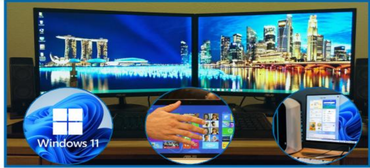
تكوين تقسيم الشاشة.