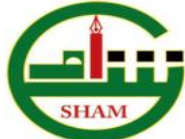
ممنبر أدباء بلاد الشام

ما بين الدهشة والدهشة! شعر: سماح خليفة . ممنبر أدباء بلاد الشام - فلسطين .