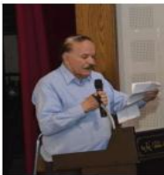
ممنبر أدباء بلاد الشام

انها أرضنا يا غزاة البلاد .. نهزها يجرها صخرها قمحها عشيقها ولتلال لنا والتراب حيها حقة .. دنها لا هج في الفؤاد هي احلانا والني المراد دمننا دونها والرقاب .. مدولدتا حيونا صفارا على صدها أرضعتنا حبيب الحنان وضمت طفولتنا مثل أم لنا فمن نهزها كم شربنا ومن خبزها كم أكلنا وقمحا بمنجل أجدادنا