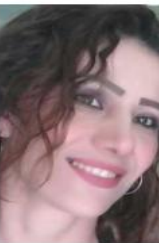
ممنبر أدباء بلاد الشام

هذا الأدباء كثر وقوما وتأخيرا على المتلقي من الشعارات ولخطابات الزئانية . وقد طرق في قصصه هذه عشرات المواضيع اللافتة التي يعيشها شعبنا، ولم تخل هذه القصص من شذرات تشكل جزءا من حياته ومن سيرته الذاتية، وهذا ما كشفه في الأسطر الأربعة الأخيرة من الصفحة 216، وهي السطر الأول من الصفحة 2017.