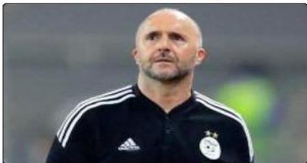
القيادة الودية في نفس الموعد، أي بعد 48 ساعة من مواجهة أوغندا، المقررة

على ملعب جابوما، مدينة دوالا في الكاميرون. وأكسدت المصادر أن مسؤولي اتحاد كرة القدم الجزائري طسبوا كافة الإجراءات المتعلقة بمحورين المواجهتين. وأوضح: «سنتقل بعثة الخنازين صبيحة يوم السبت 17 يونيو/حزيران إلى الكاميرون، على متن طائرة خاصة». وستعود البعثة الجزائرية فور نهاية مواجهة أوغندا إلى مدينة عنابة، حيث تحوّل مساء يوم الاثنين 19 يونيو، مرانها الأخير بملعب 19 مايو، قبل مواجهة نسور طراج في اليوم التالي.