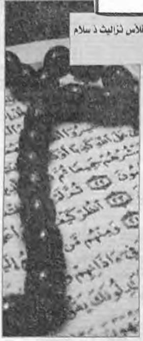
فلاس وتلمذن فلاس لوماس يلا امر اثيشرن

وات اسفرحن اسوين افتحبي اذ يكنو وذ يسجد ارب المند ار تشكر غف اين اذدهكا افوين نالخير نغ مايلا يسمنعيت نغ احرزيث نغ يكس فلاس رب اين انقرحن نغ اين ارتضون يلا ذغن وشبيح نبي فلاس نزاليث ارب ذ سلاميس اسجد اشتك يلا اخذميت المند اكن ارد سيقن امك افوكلال رب ثمرت اكن ار تحمندن وات شكرن لعياذيس غف يال اين اذندفكا ذ الخير نغ ثوكسا نالشر ابتادم غس اين يشكر اور يزيمر اذ يصوط اذده اريفك نغ اذ افاضع الخير ارب ذشو كان يسبقند وشبيح نبي فلاس نزاليث ذ سلام ارب ثوتسرا اكن ماشي كان اسواوال ذغا اس لفعال امي ذين يلا اخذم اسميانيس وذاسيقن البسة اك في غفلن ثفرز نغ ايتسون مدن المند اكن ار ثودرت اتسن واذا اسحيون يوث نالسة ايتون اطاس تيمداتن.