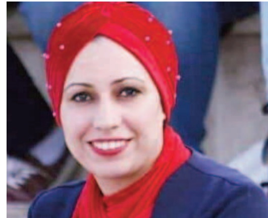
بقلم: تمارة حداد

أجل حرية الأوطان فيها منابر الأمجاد ضحت بأرواح ثمينة من أجل نيل مهابتها ومن أجل جذور النصر وزحزحة الظلم فيها مكارم الأخلاق انتصرت على الأعداء في زمن الطغيان ارتبطت جذورها بجذور فلسطين والشحمة بينهما الوفاء والوفاء. فالشعب الجزائري هو شعب المليون ونصف المليون شهيد الذي نال استقلاله وظل محافظا على تراثه وثورته، لذلك نجد هذا التضامن المتميز بين الشعب الجزائري وقيادته مع الشعب الفلسطيني والتعاطف يأتي من تقاطع النظر بين ما مرت به الجزائر من ثورات وما مرت به فلسطين من نكبات، فالعلاقة بين الشعب الفلسطيني والجزائري هي علاقة وطيدة تقضيها روح الثورة فالشعب الجزائري وقف دوما إلى جانب الشعب الفلسطيني والعلم وفرفر بأيدي أبناء الشعب الجزائري تضامنا وإسنادا وحبا ومن أروع أمثلة التضامن مع الشعب الفلسطيني هو