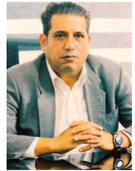
بقلم: دكتور نوافل أبو عطوي

في الثاني والعشرين من شهر ايار-مايو، انطلقت في العاصمة الجزائرية، أعمال الندوة الدولية تخليداً للذكرى 75 لنكبة فلسطين عام 1948، حيث تم احتلال الأراضي الفلسطينية من قبل الاحتلال الصهيوني، وطرد وتهجير السكان، الفلسطينيين من بلداتهم الأصلية، حيث أصبحوا بسبب احتلال أراضيهم لاجئين مشردين في مخيمات اللجوء والشتات في كافة أصقاع العالم، لشهد العالم بأسره على أطول استعمار عالمي مازال محتلاً للأرض الفلسطينية. الندوة العالمية التي أقيمت بالعاصمة الجزائرية، في المركز الدولي للمؤتمرات في قاعة "عبد اللطيف رحال" بمناسبة مرور 75 على نكبة فلسطين، كان لها الأثر الكبير والعظيم في نفوس جميع الفلسطينيين، لأنها تعتبر من أهم الفعاليات التي تقام في الدول العربية، وخصوصاً في دولة الجزائر الشقيقة التي كانت ومازالت وستبقى على عهدها الوطني والإنساني تجاه القضية الفلسطينية وعبدالنها حتى الوصول للحرية والاستقلال. إن حضور أكثر من 1200 إعلامية وفعاليات ومؤسسات مجتمعية، يعتبر الحدث الأهم والأبرز على المستوى الرسمي للجزائر، لأنها المرة الأولى التي يتم بها إحياء ذكرى النكبة الفلسطينية على هذا المستوى الرفيع شأنًا وقيمة من حيث الحضور البارز للعديد من الشخصيات الهامة والرفيعة على مستوى الجزائر والضيوف المشاركين