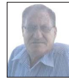
بقلم: رشيد حسن

غفير وسموريتش» هو امتداد لقادة عصابات «الهاغانة وشترين والارغون».. الثانية .. ان استمرار المقاومة وتطويرها.. وانضمام كافة شرائح الشعب الفلسطيني لهذا المارد الثوري.. هو الكفيل بكسر ظهر هذه العصابات واستئصالها من كل الأرض الفلسطينية ورميها كقذورات في أعماق البحر ..