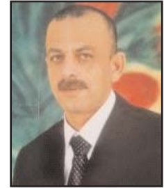
بقلم: فتحي أحمد

الطغمة الحاكمة في إسرائيل، من ضمنها ما تفوه به نتياهو حول القدس وأحقية الصهاينة فيها، وما جاء به بن غفير خلال جولته في باحات المسجد الأقصى حيث قال: نحن المسؤولون هنا.