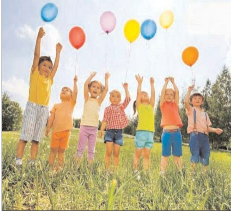
كل زمان ومكان، خوفاً من حوادث الاختطاف التي تقلصت بسبب حنكة تلاشي الظاهرة إلا ان رعب الأولياء مستمر ولا زالوا "بودي قارد" لأطفالهم في

هي وقائع وأخرى يعيها الطفل الجزائري ناهيك عن الرسوب المدرسي، وآفات التدخين وحتى المخدرات التي تزحف إلى المدارس، وشبح الانترنت والتكنولوجيا الذي يهدد الأطفال بويلاته العديدة الناجمة عن سوء استخدام الوسائل الالكترونية، فمسؤولية الأسرة والمجتمع ككل هي كبيرة في تنشئة أجيال سليمة.