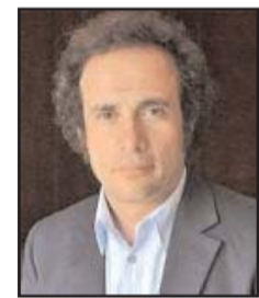
بقلم: عمرو حمزوي

السلمية وخطوات الدبلوماسية الهادئة، تكتسب بكون يوماً بعد اليوم المزيد من تأييد عواصم الجنوب العالمي التي صارت ترحب بالتجارة والاستثمار والمساعدات الاقتصادية الصينية وصارت تعمل أيضاً على الالتحاق بالمنظمات والتجمعات الاقتصادية الدولية التي تقودها مجموعة البريكس ومنظمة شنغهاي للتعاون وتسعى إلى تشجيعها على التوسط لحل الصراعات وحفظ السلم والأمن إقليمياً وعالمياً.