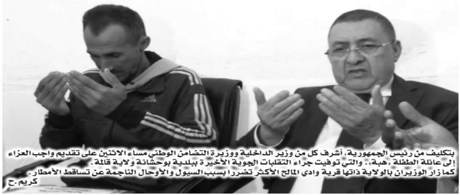
بتكليف من رئيس الجمهورية، أشرف كل من وزير الداخلية ووزيرة التضامن الوطني مساء الاثنين على تقديم واجب العزاء إلى عائلة الطفلة «هبة»، والتي توفيت جراء التقلبات الجوية الأخيرة ببلدية بوحشانة ولاية قالة. كما زار الوزيران بالولاية ذاتها قرية وادي المالح الأكثر تضررا بسبب السيول والأحوال الناجمة عن تساقط الأمطار. كريم ح.