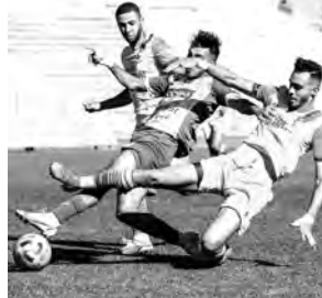
تعداد الشبيبة منقوصا من خدمات عدة لاعبين، ويتعلق الأمر بكل من سوياد، نشاط، بوخوشوف، بن زايد وقفينه، بسبب الإصابة، فيما سيغيب أوقاسي بداعي العقوبة.

يُسمى شبيبة القبائل، عشية اليوم، عند تنقله إلى عاصمة الهضاب العليا، لمواجهة وفاق سطيف، في مهمة تأكيد الاستفاقة وتحقيق نتيحة إيجابية، في مواجهة صعبة بالنسبة للفريقين، المطالبين، خاصة الشبيبة، بتفادي الهزيمة، من أجل تأكيد الاستفاقة الأخيرة، بعد النتائج الإيجابية المحققة، لابتعاد أكثر عن الخطر من اللطاقم الحمراء. وكانت فترة توقف البطولة فرصة للطامح في قيادة المدرب يوسف بوزيدي، من أجل معالجة الأخطاء التي وقف عليها وضمان جاهزية اللازمة لحصد أكبر عدد من النقاط في المباريات المتبقية، والاستجابة لتطلعات الأنصار، من خلال إنهاء البطولة في مرتبة مشرفة، حيث أن التشكيلة استعادت الثقة في النفس، وأبدى رفاق موافق عزمهم على مواصلة المشوار بنفس الوتيرة، وتحقيق البقاء قبل نهاية البطولة، وهو ما وقفنا عليه، من خلال الرزية الكبيرة التي أظهرها اللاعبون، لتحقيق النتيجة المرجوة في لقاء اليوم، أمام وفاق سطيف، في مباراة تعتبر بمثابة التأكيد للشبيبة، التي لم تضمن البقاء في الرابطة الأولى وتحتاج إلى نقاط أخرى، حيث قال المدرب بوزيدي في هذا الإطار: "نخوض مباراة هامة ومصيرية أمام وفاق سطيف، فتحن مطالبين بحصد أكبر عدد من النقاط، التي تسمح لنا بتحقيق الهدف المسطر، سنعمل كل ما في وسعنا للعودة بنتيجة إيجابية، والابتعاد أكثر من منطقة الخطر، رغم أننا ندرك بأن المهمة ستكون صعبة"، وسيكون