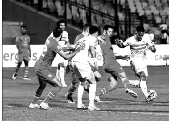
منذ فترة طويلة إلى القسم الثاني هواة، في حين أن أمل الأرباء سواجيه على ملعبه، نادي جمعية الشلف، المنتمي بالتأهل إلى نهائي كأس الجزائر، بعد تجاوزه أهداف لهاف، يوم الجمعة الماضي.

يتقدمون بنقطة واحدة فقط عن نادي بارادو، صاحب المركز ما قبل الأخير، والذي سيستقبل بدوره نادي مولودية البيض في لقاء، شعاعه؛ ممنوع الخطأ بالنسبة للباك إن أراد تفادي السقوط، وهو إليه اتحاد بسكرة، عندما يستقبل شباب قسنطينة، الباحث عن تعزيز تواجه في مركز الوصافة، بحثا عن شباب بلوزداد، أياما فقط بعد أن حرمه الأخير من التأهل إلى نهائي كأس الجزائر، ولن يفرض أشبال المدرب آيت جـودي، في نقاط الفوز، للهررب تدريجيا من منطقة الخطر، وهم الذين