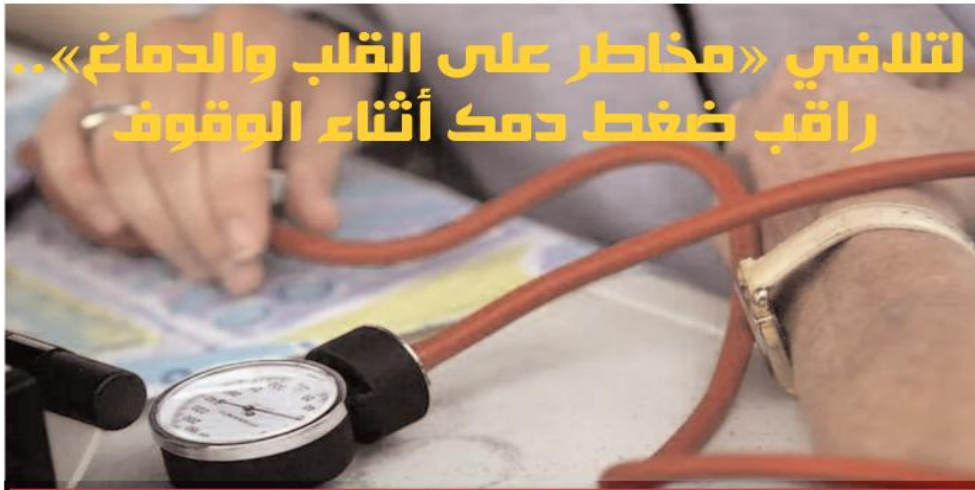
في دراسة طبية حديثة، ربط باحثون إيطاليون بين ارتفاع ضغط الدم عند الوقوف، واحتمالية الإصابة بالثوبات القلبية والسكتة الدماغية.

قد ترتبط المخاطر المرتبطة باستهلاك هذه المشروبات بسمية بعض مكوناتها، أو بالظروف التي يتم فيها استهلاك هذه المشروبات.