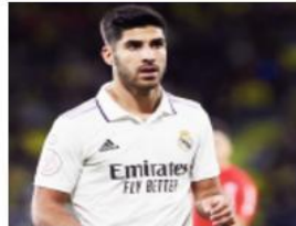
هدفا مع تقديم 8 تفريرات حاسمة، بإجمالي 1964 دقيقة لعب.

كارلو أنشيلوتي المهاجم الإسباني، لكن النادي لا يستطيع أن يضمن لأسينسيو الحصول على الأذوار التي يرغب اللاعب في توليها بالفريق. ولا يتعلق الأمر بمدى التزام اللاعب، الذي لا يشكك فيه النادي، إذ خاض أسينسيو بعض المباريات رغم شعوره بالألم عضلية. وفي حال تأكيد رحيله، فسيكون لدى الجناح الإسباني فرصة لتوقيع جماهير الريال يوم الأحد المقبل في مواجهة أتلتيك بلباو. جدير بالذكر أن أسينسيو شارك في 50 مواجهة مع ريال مدريد عبر مختلف المسابقات بالموسم الحالي، أحرز خلالها 12