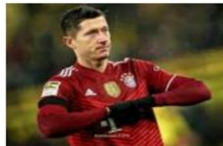
للمرة الخامسة تواليا، والسابعة في مسيرته.