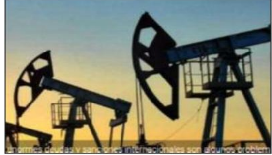
ويحلول الساعة 06:36 بتوقيت غرينتش زادت العقود الآجلة خام برنت 45 سنتا أو 0.58٪ إلى 77.40 دولار للبريل، وارتفعت العقود الآجلة خام

السبت إلى اتفاق من حيث المبدأ لتطبيق سقف الدين الحكومي البالغ 31.4 تريليون دولار. وعبر كلاهما عن ثقته أمس الأول في أن الأعضاء الديمقراطيون والجمهوريين في مجلسي النواب والشيوخ سيدعمون الاتفاق. لكن الأسواق قد تتعصف الصعده لفترة وجيزة وحسب لأن مجرد الموافقة على الاتفاق من المتوقع أن تصدر وزارة الخزانة الأمريكية سندات تتسبب في تقليص السيولة أكثر وزيادة تكلفة التمويل للشركات التي تعاني بالفعل بسبب ارتفاع أسعار الفائدة. ويلتزم بعض المستثمرين بالخزفي ظل مؤشرات على أن مجموعة «أوبك+» التي تضم منظمة البلدان المصدرة للبترول (أوبك) وحلفائها ومنهم روسيا قد تدرس تخفيضات إضافية للإنتاج في اجتماعها الذي يعقد في الرابع من يونيو. كما يترقب المستثمرون بيانات قطاعي الصناعات التصنيعية والخدمات في الصين هذا الأسبوع، وكذلك بيانات الوظائف في القطاعات غير الزراعية في الولايات المتحدة يوم الجمعة بحثا عن مؤشرات على النمو الاقتصادي والطلب على النفط.