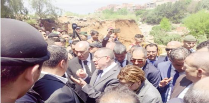
مسؤول بوزارة الصيد البحري والمنتجات الصيدية: