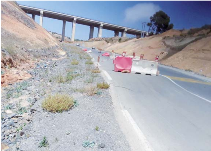
سيدي محمد بنات

يعتبر الطريق السيار في شقه الرابط بين منطقة دار بن طاظا وتيانت بدائرة الغزوات وبالضبط على بعد حوالي 400 متر من مفترق الطرق أمام مصنع الخشب خطرا كبيرا على السائقين وكل مستعمليه ، لأن هذه الجزء من الطريق عرف إنزلاقا كبيرا وأصبح غير مستوي مع بقية المسلك ، وهو ما بات يشكل خطرا حقيقيا على سلامة وأرواح السائقين ، حتى أن العديد منهم كادوا أين يتعرضوا لحوادث انقلاب بسياراتهم ، ويحدث رغم أنه لم يمر على تدشين الطريق حتى سنة كاملة ، من جهتها قامت السلطات المحلية لبلدية تيانت بمراسلة الجهات المعنية حول هذا المشكل الخطير ، إلا أن الأمور لا تزال على حالها ، وعليه يناشد المواطنون وسائقو المركبات التدخل العاجل من أجل إصلاح هذا الجانب من الطريق قبل وقوع حوادث خطيرة خاصة و أن الطريق يعرف حركة نشيطة لمختلف المركبات لاسيما ونحن مقبلون على موسم الاصطياف والطريق يستعمل للتوجه نحو مختلف الشواطئ والأماكن السياحية.