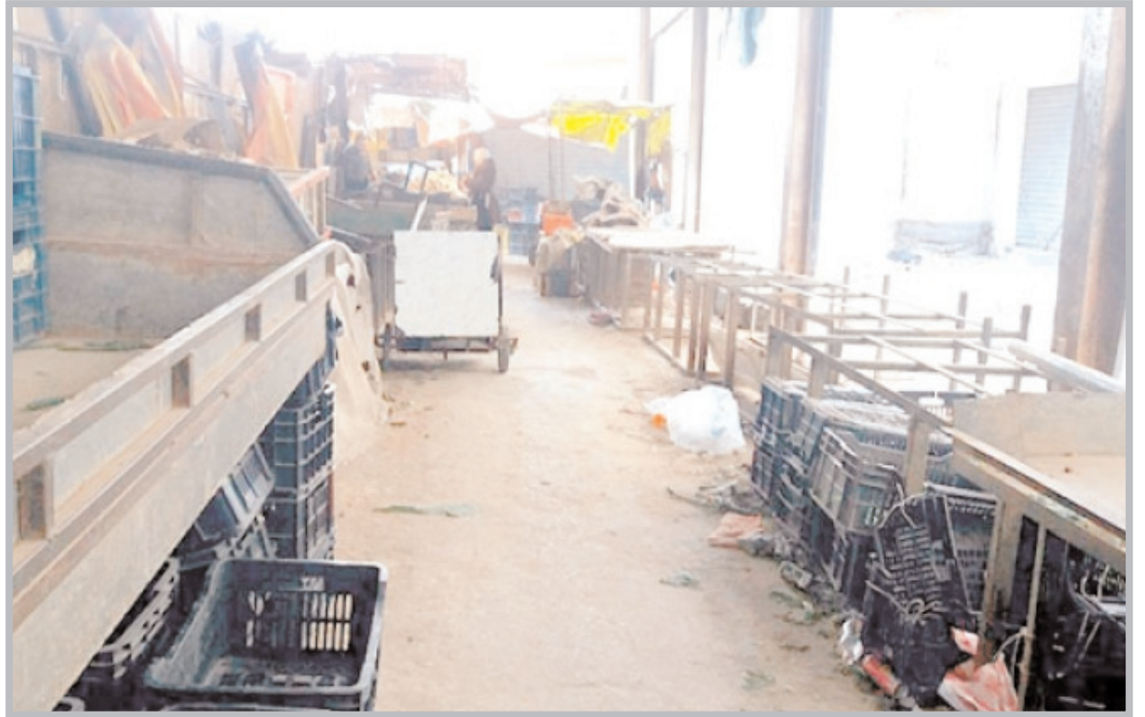
لامتصاص مياه الأمطار.

قررت السلطات المحلية بقسنطينة، إعادة الاعتبار لسوق "العاصر"، الواقع بقلب المدينة القديمة، والذي يعد معلما من المعالم التاريخية بعاصمة الشرق، بعدما فقد بريقه خلال السنوات الفارطة، بسبب الإهمال، من جهة، وعزوف المواطنين عن زيارة هذا الفضاء التجاري، نتيجة هجرة عدد كبير من التجار، في ظل ما آلت إليه وضعية طاوولات وهيكل السوق، من جهة أخرى