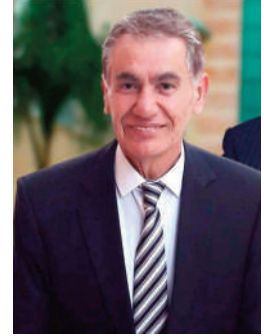
بقلم: جلال حسين نشوان

تشكل الجزائر السند الكبير للشعب الفلسطيني وقضايا الأمة كلها ويأتي هذا الدور البطولي من مخزونها الشجوري والحضاري والتاريخي وموقعها الجغرافي، واعتبارها مركزا ثقافيا وسياسيا للعالم العربي في عهد الرئيس تون كمشروع يهدف إلى تحقيق الوحدة والتنمية والنهضة العربية. هذا الأمر أهل الجزائر لتلعب دور الدولة النموذج سياسيا التي يتوجب عليها نتيجة لتقلها القيادي في المنطقة على نحو يعيد دور الأمة وتأثيرها في السياسة الدولية، يعيش القضاء العربي تحولات جذرية على مستوى بنيانه الأساسية، أفضتها استبياعات تاريخية، فاستطاعت السياسة الأمريكية اقناع بعض الدول العربية بالسير في ركب الطغيان، لذا قامت السياسة الجزائرية الوطنية بمناهضة هذا التوجه والعالم كله شاهد وسمع وزير الخارجية الجزائري رمضان لعمامرة عندما قاد حملة دبلوماسية قوية لتجديد موقف الفريقي رافض لوجود كيان الاحتلال الغاصب فر القارة الإفريقية الخطوة، وقام باتصالات وجولات دبلوماسية أثمرت عن موقف قوي معارض لوجود كيان الاحتلال الإحتلال الصهيوني الغاصب، فالجزائر الحبيبة عودتنا على حمل الهمم الفلسطيني في كل المحافل العربية والدولية، وفي أحياء الذكرى 75 المئوية للشعب الفلسطيني، احتضنت الجزائر بالمركز الدولي للمؤتمرات أعمال الندوة الدولية الخلد للذكرى الـ 75 للنكبة الفلسطينية تحت شعار "النكبة جريمة مستمرة والعودة حق، وشراف على تنظيم الملتقى الدولي وزارة المجاهدين وذوي الحقوق،