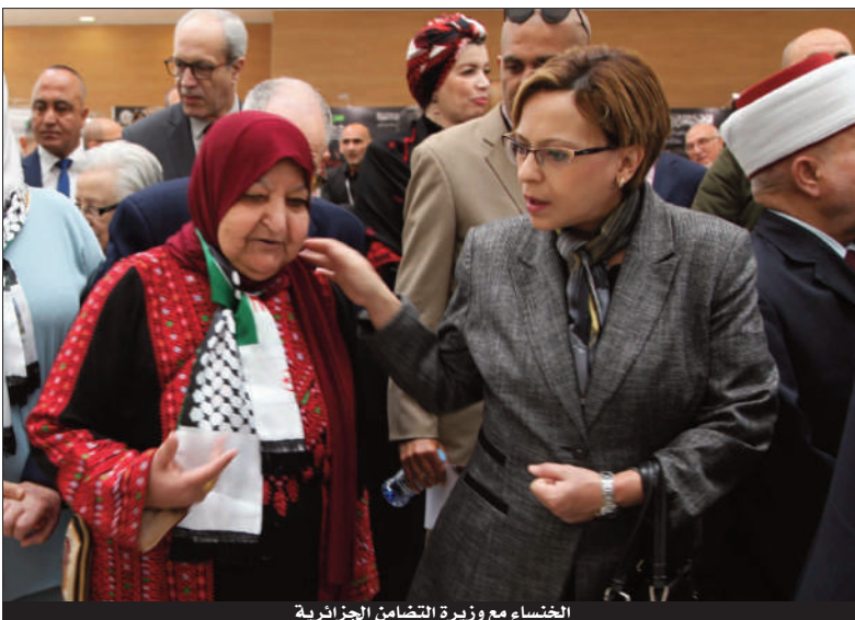
الخنساء مع وزيرة التضامن الجزائرية