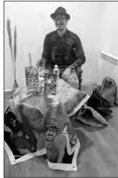
أما عن اختياره شابة بنعمر أحمر، فهذا يرجع إلى عدم تحمّل مصاصي الدماء اللون الأحمر، وهكذا تضاعف المقاومة عبر الزمن.

تحدي القضاء عليهم من طرف امرأة بنعمر أحمر. كما تحدث دالي عن قرب صدور روايته التي كتبها قبل خطفه هذا العمل الذي صدر باللغة الفرنسية، والتي تلتزم فيها عبر العالم العجائبي، لأمريكيين يزورون الجزائر ويتعرفون على ثقافتها. وفي هذا السياق، أكد المتحدث ضرورة عدم العزلة، وتجاهل العولمة، بل طالب بالاحتكاك بهذه الحضارات الطاغية، وفي نفس الوقت التعريف بثقافتنا المحلية الثرية جدا والمتنوعة، خاصة من خلال ضيق أساطير وحكايا كثيرة. ودعا الأستاذ اللغة الإنجليزية الذي ترجم عمله إلى هذه اللغة، إلى مواكبة التطورات الحاصلة في الأدب؛ مثل انتشار الأدب الفانتازي أو العجائبي الذي له جمهوره في الجزائر، وهذا رغم خوف الناشئين منه.