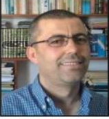
المشهد الأول ..

مَسْرِحِيَّة .. بلا عنوان .. منير الصويدي القيروان - تونس