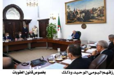
بخصوص قانون القوتبات

كخفاضة تشهد انتشارا واسعا تستدعي المواجهة. بخصوص مشروع قانون يحدد القواعد العامة للصقلات العمومية. أكد السيد الرئيس على أهمية التكوين في هذا المجال مبرزا ضرورة الإعداد لدراسات دقيقة لمختلف المشاريع بمعايير علمية. إدراج الصحافة الإلكترونية المعتمدة كإلية جديدة للإشهار الصقلات العمومية وعدم إلتفاتا على الصحافة المكتوبة كما كان معمولا به.