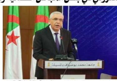
بخصوص مشروع قانون القوتبات

الغرض، وأشار وزير العدل إلى أن الوصول إلى التقاضي الإلكتروني يرتكز بصورة أساسية على تطوير البنية التحتية للقطاع، وذلك من خلال مواصلة جهود التنظيم الحكم لها وفق المعايير الدولية المعتمدة بالنظر للتهديدات العالمية للتنمسية التي يعرفها مجال المعلوماتية، إلى جانب تحقيق الاستقلالية التكنولوجية من خلال الاعتماد على الكفاءات الوطنية للقطاع في تطوير الأنظمة المعلوماتية. وأشار الوزير طي في هذا الجانب إلى أهمية التقاضي الإلكتروني من خلال السماح بالتبادل الإلكتروني للمرافض والذكريات بين الأطراف وهي العملية التي انطلقت ببعض المجالس القضائية لوجعية على أن تعمم تدريجيا لتغطي كل الجهات القضائية بهدف تبسيط إجراءات التقاضي.