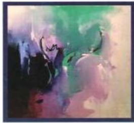
جست علي البطرات