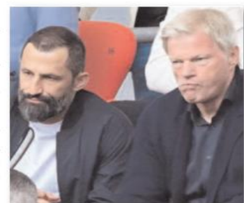
أعلن رئيس بايرن ميونخ الألماني هيربرت هايزر إقالة رئيسه التنفيذي أوليفر كان ومديره الرياضي يوليوس حسن صالح حميدجيتش من منصبيهما.

بعد دقائق من حصد لقب الدوري الألماني للموسم الحالي 2022-2023، عصر السبت بالفوز على كولن 2-1. وجاء القرار بعد فترة من التتر شهدها الفريق بالموسم الحالي، بعدما كان الشناتي حميدجيتش وأوليفر وراه اتخاذ قرار الإطاحة بالمدير السابق يولييان ناغلسمان بشكل مفاجئ وتعيين توماس توخيل خلفًا له. وتكّن بايرن ميونخ من الحفاظ على لقبه في "البوندسليغا"، بفوزه خارج القواعد على كولن بالجولة الأخيرة بملعب "ريهن إنرجي ستاديون" بهدفين لواحد، مستغلا تعادل منافسه بوروسيا دورتموند 2-2 في ملعبه أمام ماينز 2-2. ورفع النادي البافاري رصيده إلى 71 نقطة بعد فوزه على كولن، وهو نفس رصيد بوروسيا دورتموند الذي خسّر اللقب بفارق الأهداف الذي صبّ في صالح كتيبة المدرب الألماني توخيل. وقال رئيس النادي، روبرت هايزر لوسائل الإعلام في المنطقة المختلطة "ربما لمعلم