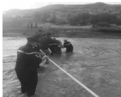
على مدر 24 ساعة.