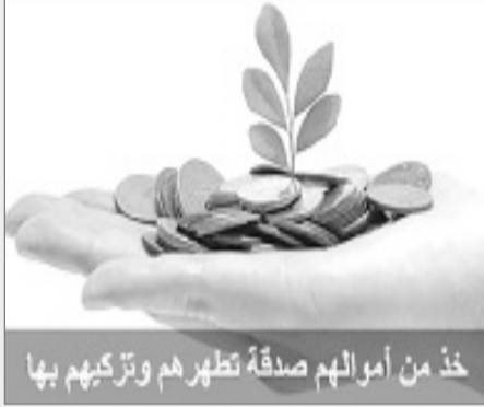
خذ من أموالهم صدقة تطهرهم وتزكّيهم بها

قال الله سبحانه وتعالى: (خُذْ مِنْ أَمْوَالِهِمْ صَدَقَةً تُطَهِّرُهُمْ وَتَزَكِّيهِمْ بِهَا وَصَلِّ عَلَيْهِمْ إِنَّ صَلَاتَكَ سَكَنٌ لَهُمْ)، قال العلامة ابن عاشور: [الآية دالة على أن الصدقة تطهر وتزكّي. والتزكية: جعل الشيء زكيا، أي كثير الخيرات].