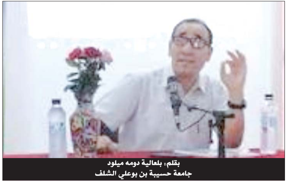
بقلم: بلعالية دومه ميلود جامعة حسية بن بوعلي الشلف

إن انخراط الوعي العربي الجاهلي ضمن زمنية الانحدار والفناء، فرض علاقة متوترة بالزمن (تماما مثل علاقته بالمكان). يظهر ذلك التوتر في عدم القدرة على مقاومة صروف الدهر ونوابه، ومن ثم الانتهاء إلى حالة من التشاؤم، تتفاقم بتفاقم الإحساس بالكبر ودنو الأجل. فاقتران الموت بمفهوم النهاية في ذهن الشاعر العربي الجاهلي، يكشف عن نظرة محدودة للزمن، لا تتعدى مجال مدركاته الحسية والتي تفصح عنها علاقته المباشرة بالمكان. ويقدر ما تماثل أجزاء المكان أمام ناظريه، بقدر ما تتماثل في تصويره "آنات"