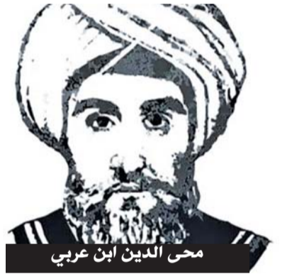
محي الدين ابن عربي

سلام على سلمى ومن حل بالجمي وماذا عليها أن تزد تحيية سروا وظلام الليل أرخي سدوله أحاطت به الأشواق صونا وأرصدت فأبدت ثايبها، وأومض بارق وقالت: أما يكفيه أني بقلبه