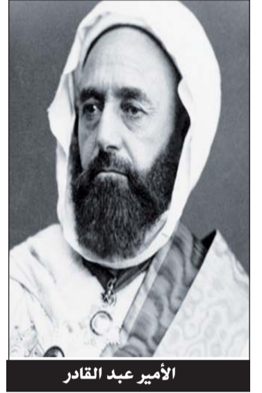
الأمير عبد القادر

تساءلني أم البنين وإنها لأعلم من تحت السماء بأحوالي ألم تعلمي يا ربة الخدر أنني أجلى هموم القوم في يوم تجوالي وأغشى مضيق الموت لا متهيبا وأحمي نساء الحي في يوم تهوال يثقن النسابي حيثما كنت حاضرا ولا تتقن في زوجها ذات خلخال أمير إذا ما كان جيشي مقبلا وموقد نار الحرب إذ لم يكن صالي إذا ما لقيت الخيل إني لأول وإن جال أصحابي فإني لها تال أدافع عنهم ما يخافون من ردي فيشكر كل الخلق من حسن أفعالي وأورد رايات الطعان صحيحة وأصدرها بالرمي تمثال غريال ومن عادة السادات بالجيش تحتمي وبي يحتمي جيشي وتحرس أبطالي