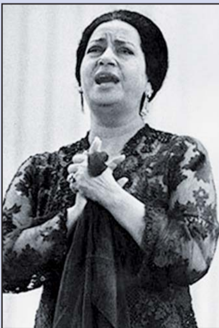
والقصبجي، فيما تمسكت أم كلثوم بالأسلوب التقليدي طويلا، قبل أن تتخلى عنه لاحقا.