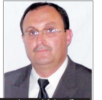
بقلم جواد كتاب - وهران

تم إنشاء هذا المنتزه من قبل الجنود الفرنسيين ، بناءً على أوامر الجنرال ليتانغ ، القائد العسكري للمقاطعة من 10 أوت 1836م