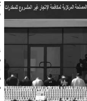
المصلحة المركزية لمكافحة الاتجار غير المشروع بالمخدرات

بعد استغلال معلومات وارده عن وجود حمولة ضخمة من المؤثرات العقلية ستحول من جنوب البلاد إلى شمالها. وبفضل التحريات المكثفة التي باشروها محققو SCLTIS، تحت إشراف النيابة المختصة، مكنت من كشف الحيلة الإجرامية للشبكة. واستعملت الشبكة، شاحنة ذات صهريج خاصة بنقل مسحوق الإسمنت، للتمويه بغرض تمرير هذه الشحنة من المؤثرات العقلية. وبعد تتبع هذه الشاحنة بدقة طيلة مسارها إلى غاية مدينة عين ولمان بسطيف، تمكن عناصر ذات