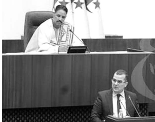
المهني والإدماج الاجتماعي لحاملي الشهادات، مبرزا أن عملية إدماجهم تمت بموجب المرسوم التنفيذي رقم 19-336 المؤرخ في 8 ديسمبر 2019 المتعلق بإدماج المستفيدين من جهازي المساعدة

وأوضح بن طالب، في جلسة علنية بالمجلس الشعبي الوطني خصصت لطرح أسئلة شفوية على عدد من أعضاء الحكومة، أن "عملية إدماج حاملي الشهادات تشرف على نهايتها وفق البرنامج المسطر، وذلك قبل نهاية سنة 2023". وأشار إلى "الانتهاء من عملية تحويل جميع عقود جهاز نشاطات الإدماج الاجتماعي المستوفاة للشروط القانونية"، مضيفاً أن "أزيد من مليوني (2) شاب استفادوا في إطار جهاز المساعدة على الإدماج المهني". وثنى الوزير في هذا الصدد جهود الدولة من خلال عملية إدماج المستفيدين من جهازي المساعدة على الإدماج