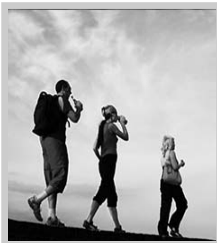
الأسبوع عن أولئك الذين يمشون أقل. - تقوية

العظام: أثبتت أبحاث أجريت على نساء في سن ما بعد إنقطاع الطمث أن كثافة العظام أكبر لدى من يمشين أكثر من ميل في اليوم بالإضافة إلى إنخفاض في معدل فقدان العظم لخلاياه. - مقاومة الاكتئاب؛ في إحدى الدراسات، قلت أعراض الاكتئاب بنسبة 47 لدى من قاموا بالمشى لثلاثين دقيقة يومياً، من ثلاثة لخمسة أيام كل أسبوع ولمدة 12 أسبوعاً. - الوقاية من سرطان الثدي والقولون؛ عند النساء اللاتي يقمن بالمشى ساعتين ونصف أسبوعياً تنخفض خطورة الإصابة بسرطان الثدي بنسبة 18 عن اللاتي لا يمارسن المشى، كما أشارت أبحاث أخرى عدة لذات التأثير على سرطان القولون، وإلى دوره في خفض نسبة الوفيات حتى لمن أصيبوا بالفعل بالمرض. ناهيك عن عشرات الفوائد الأخرى التي لو ظللنا نحصيها، ربما لا يتسنى لك الوقت لتنهض وتمشي! كيفيك فقط أن تقتنع بأن المشى هو أفضل دواء!