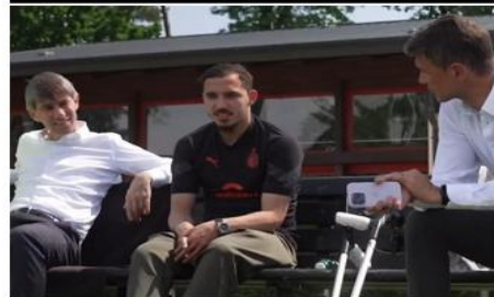
نصف نهاي دوري أبطال أوروبا يوم 10 ماي الفارط، حيث سيقب على إثرها لمدة لا تقل عن 06 أشهر.

في ظل عدم قدرته على التدريب واضطراره لاستخدام العكازين من أجل المشي، كما كان نجم الخضر حديث مع باولو مالديني وبعض مسؤولي النادي الآخرين خلال توقيت سير الحصص التدريبية، ولم يكشف نادي ميلان إذا كان بن ناصر قد باشر عملية إعادة التأهيل حتى الآن، وهذا بعد مرور أسبوع واحد من إجرائه للعملية الجراحية، كما فضل النادي التستر على نوعية الإصابة التي تعرض لها اللاعب الجزائري على الرغم من أن تقارير صحفية إيطالية كشفت معاناته من تمزق في أربطة الركبة، واضطر بن ناصر للخضوع