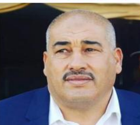
المسابقة قد تم اتخاذه بعد انعقاد المكتب الفيدرالي وتم تعيين الحكم عبيد

ردت الاتحادية الجزائرية لكرة القدم على الاتهامات التي أطلقتها إدارتي شبيبة السورة ونجم مقرة بشأن مكان خوض مواجعتي نصف نهائي كأس الجمهورية وهددتا بمقاطعة مبارياتهما ضد شبا ببلوزداد وجمعية الشلف على التوالي، في حال تقرر برمجتها على ملاعب معابد من أجل تقنية الفار، وقالت الشاف في بيان عبر موقعها الرسمي: تذكر لجنة