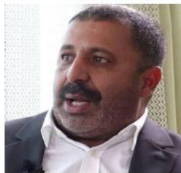
شارف مسؤولا على التقنيّة، المكتب الفيدرالي قررا إعطاء مسؤوليّة