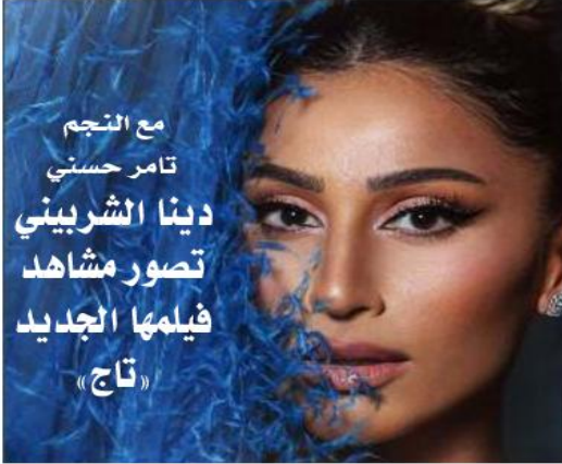
مع النجم تامر حسني دينا الشربيني تصور مشاهد فيلمها الجديد «تاج»

تتابع الأحداث. ويشارك حسني والشربيني كل من ساندي ويومي فؤاد، وإياد نصار، وعصام السقا، وسوسن بدر وهالة فاخر. والفيلم من تأليف تامر حسني وإخراج سارة الشربيني لتجسد دور البطولة مع تامر حسني في الفيلم المرتقب عرضه في دور السينما خلال موسم عيد الأضحى المبارك. وتصدر اسم دينا الشربيني ترند تويتر في مصر بعد ترحيب تامر حسني بانضمامها إلى الفيلم، وإعرابها عن مسعادتها بالشاركة، فهي وصلة عزول بين النجمين، غرد حسني عبر تويتر قائلًا: وتدور أحداث فيلم «تاج» في إطار كوميدي فانتازي، حول تيمة الظل الحارق «سوبر هيرو»، ويجسد تامر حسني شخصيتين لشقيقتين توأم اسمهما تاج وهارون، ويمران بالعديد من الأزمات مع