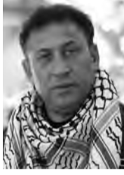
بقلم: سالم إبراهيم فودة