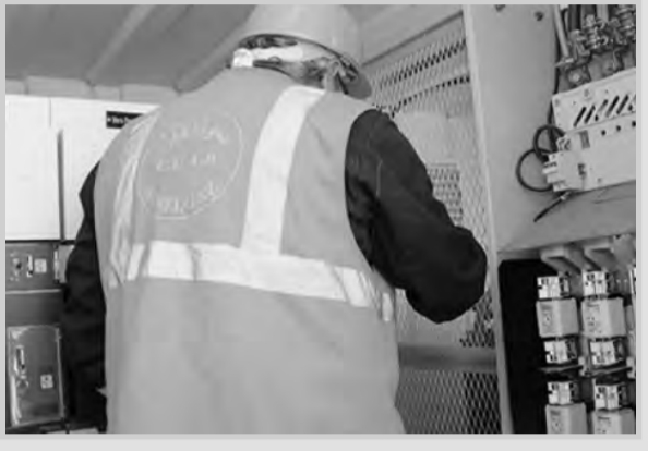
سمرت مديرية توزيع الكهرباء والغاز لسيدى عبد الله (العاصمة)، مخططا خاصا لضمان استمرارية ونوعية التزويد بالتيار الكهربائي، خلال فترة إجراء امتحانات شهادتي التعليم المتوسط والكالوريا المزمع إجراؤها بداية شهر جوان المقبل، حسبما أفاد به، أمس الأربعاء، بيان صادر عن ذات المديرية.

كما يتمثل هذا المخطط في "الصيانة القبلية لجميع المنشآت المزودة لمراكز تحول الكهرباء التابعة للمؤسسات التربوية من متوسطات وثانويات"، وكذا "التواصل مع مسؤولي المؤسسات التربوية لصيانة محولاتهم الكهربائية ومعاينة تلك التي تعرف مشاكل تقنية"، حسب ذات المصدر.