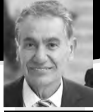
بقلم: خالد محمد حسيه شواه

الزمان يعاقب المكان، وفي فلسطين، البطولة والنضحية والفداء هي العنوان، حيث شمر أبطال فلسطين عن سواعدهم ومرغوا أنف ننتباهو وعصابته في تراب فلسطين المحتلة، انهم الأسود الذين عودونا أن يعزفوا نحن الوفاء، إنها فلسطين التي أثرت الإنسانية بنضالات أبنائها العظماء الأحرار الذين حملوا الوطن في عقولهم وقلوبهم وحدقات عيونهم، فملأوا الكون بإدعاء، وعظمة، واقتدارا... هي فلسطين التي تخوض معركة الصمود والخلود... إنها البطولة والفداء، في القدس ونابلس وغزة ورفح وجنين والخليل وأريحا والجليل والنقب، صمود اسطوري لا مثيل له، في كل بقعة من بقاع فلسطين، يلحن أبطالنا اليامين، المختلين الغزاة دروساً عظيمة، سوف يكتبها التاريخ بأحرف من نور، حيث انطلق