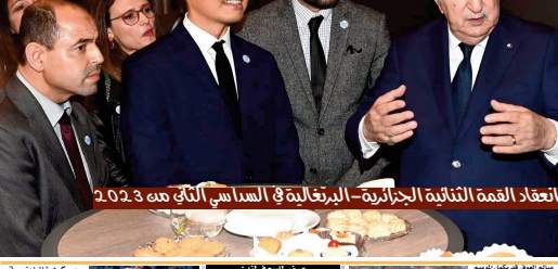
انعقاد القمة الثنائية الجزائرية-البرتغالية في السادس من أيار 2023

تم توقيع 83 فاجر مخدرات خلال أسبوع عملية تقييم وطنية لاستغان "الساكيام" البديل