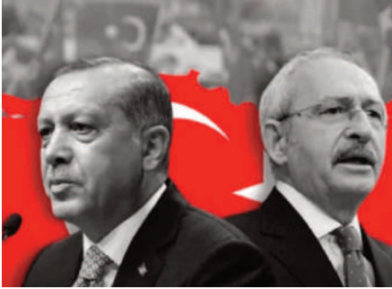
باللجنة. كما احتفظ حزب أردوغان بالأصوات في الجولة الأولى بينما حصل كليجدار أوغلو على 9.44 الحاكم وحلفاءه القوميون

والإسلاميون بأغلبية في البرلمان المكون من 600 مقعد، وهو تطور يعزز فرص أردوغان لإعادة انتخابه لأن الناخبين من المرجح ان يصوتوا له تجنباً لحكومة منقسمة، حسبما يرى محللون. وشدد كليجدار أوغلو من خطابه الأسبوع الماضي، وتعدده مساعدة اللاجئين واستبعاد أي مفاوضات سلام مع المسلحين الأكراد إذا تم انتخابه. وتتصاعد المشاعر المعادية للمهاجرين في البلاد وسط الاضطرابات الاقتصادية، وأصبحت قضية إعادة المهاجرين إلى أوطانهم رئيسية في الحملة الانتخابية.