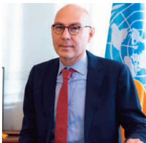
عليكما أن تصدرا تعليمات واضحة لا لبس فيها لكل من يتأمرن بأمر كما تفيد بعدم التسامح على الإطلاق مع العنف الجنسي. . . يجب حماية أرواح المدنيين ويعين عليكما وقف هذا العنف العبي على الفور". وأردف قائلا إن مكتبه وتَمَن ما لا يقل عن 25 حالة عنف جنسي حتى الآن وإن العدد الحقيقي

من المرجح أن يكون أعلى من ذلك بكثير. وفي ذات الإفادة، عبر أيضا عن قلقه بخصوص تقلص المجال أمام المجتمع المدني حول العالم، مشيرا إلى الصين على وجه الخصوص. وردا على سؤال حول كيفية متابعته لتقرير لسلفه العام الماضي وجد أن الصين ربما ترتكب جرائم ضد الإنسانية في منطقة شينجيانغ، قال تورك "نحن بصدد ذلك وسنعمل عليه باستمرار". وتنفى الصين بشدة وجود أي انتهاكات في شينجيانغ. وعبر تورك أيضا عن مخاوف أوسع بخصوص التقدم السريع في الذكاء الاصطناعي، لا سيما تقنية الذكاء الاصطناعي التي أنتجت روبوت المحادثة (شات جي بي تي)، واصفا الفرض والمخاطر بأنها "عبارة". وقال بتعيين دمج حقوق الإنسان في الذكاء الاصطناعي طوال دورته كلها، وتحتاج الحكومات والشركات إلى بذل مزيد من الجهد لضمان وجود حواجز أمان.