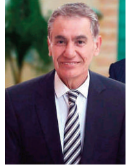
بقلم: جلال حسين نشوان

الزمان يعاقب المكان، وفي فلسطين، الطفولة والنضحية والفداء هي العنوان، حيث شمر أبطال فلسطين عن سواعدهم ومرغوا أنف تنياهو وعصائبه في تراب فلسطين المحتلة. انهم الأسود الذين عودونا أن يعرفوا لحن