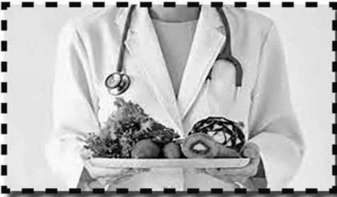
تؤدي فقط إلى هدم جزئي للجلوكوز، بينما في جوهرها، يمكن هضم العديد من الكربوهيدرات المعقدة بنفس معدل الكربوهيدرات البسيطة. توصي منظمة الصحة العالمية بأن السكريات المضافة يجب ألا تمثل أكثر من 10% من إجمالي استهلاك الطاقة.

الغذاء الصحي هو الطعام الذي يحتوي على جميع المتطلبات الغذائية التي يحتاج لها جسم الإنسان يوميا في جميع المراحل العمرية. فالغذاء الصحي السليم يعتبر الركيزة الأساسية للصحة الجيدة والجسد الخالي من الأمراض، لذلك لابد من الاهتمام بالقيم الغذائية للأطعمة التي نتناولها بشكل يومي.